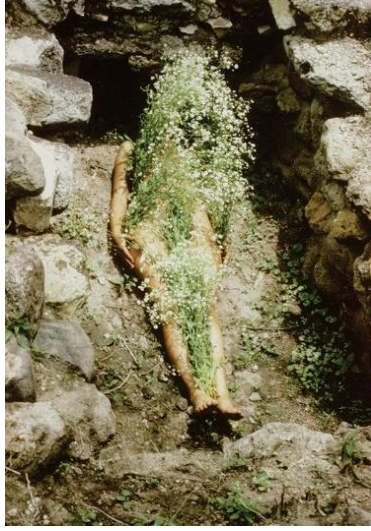
Resim 3. Ana Mendieta, Imagen de Yagul, Performans, 1973

karşısında, “yaşayan beden” kavramı yerleşmiştir. Yaşamak algısaldır ve yaşayan beden algının merkezindedir. Bununla beraber beden, zihinsel düzeyde sosyal olarak da inşa edilir. Başkaları tarafından dönüştürülen ve başkasını dönüştüren kolektif bilinçteki performatif beden fikridir bu (Balkır, 2018: 262).