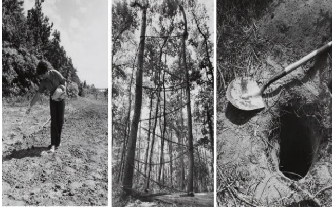
Resim 1. Agnes Denes, Pirinç/Ağaç/Mezar , Performans, 1977

Bu bağlamda ekofeminizmle ilişki kurulabilecek sanatçıların başında gelen Agnes Denes, Çevre Sanatında ve ekolojik odakta oldukça önemli hale gelen bileşik bilimler konseptiyle, sanatın yapısını değiştiren en önemli öncü figürlerinden biri olarak kabul edilir. Sahaya özgü ilk çalışmalarından olan 1968 yılında ve sonrasında 1977 yılında ürettiği Rice/Tree/Burial (Pirinç/Ağaç/Mezar) adlı çalışması (Resim 1) çevreye ilişkin ekolojik kaygılarının yanı sıra kadın ve doğa ilişkisine dair göndermeler içerir (Wildy, 2011: 57).