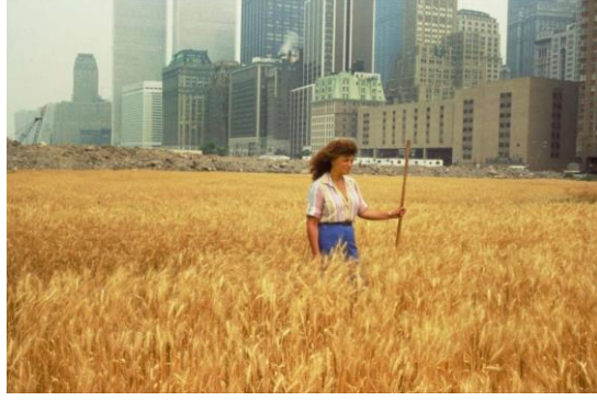
Resim 2. Agnes Denes, Buğday Tarlası: Yüzleşme , Performans, 1982

simsarlarının, ekonomistlerin, ofis çalışanlarının ve turistlerin ağırlıklı olduğu bir alandır. Bu nedenle Buğday Tarlası isimli çalışma ile Denes, kapitalizmin neden olduğu gıda güvenliği ve tüketim, inşaat, şehirleşme gibi güncel çevre sorunlarını ve kaygılarını toplumun önüne getirmeyi hedeflemiştir (Wildy, 2011: 61).