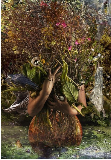
Resim 6. Christine Simpson, Ekofeminist Bir Sanatçının Portresi, Fotomontaj, 2019.

Çalışmadaki kadın figürü, kucakladığı doğa ve içinde barındırdığı canlılarla birlikte bir tür kurtuluş mücadelesi vermektedir. Kucaklayan, kapsayan ve yeniden doğumu içinde barındıran kadın bedeni, doğanın tüm şefkatini, maruz kaldığı saldırılara rağmen esirgememektedir. Ekofeminizmde öne çıkan kadının doğa sömürülerine karşı verdiği mücadele bu çalışmada temsili olarak bu figür aracılığıyla görünür kılınmıştır.