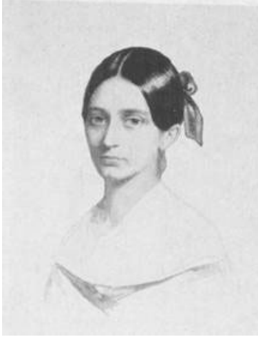
Resim 3: Clara Wieck

üstünlüğünün canlı kanıtı olacağını düşünerek kızı Clara'yı ünlü bir piyanist olarak yetiştirmeye karar vermiştir. Wieck eski bir erkek düşünüyü gerçekleştirmek için (kusursuz bir varlığın üretimi) çalışmalarına başlamıştır Clara babasının gözetiminde piyano, keman, orkestrasyon, piyano metodunun tüm pratikleri, şan ve müzik teorisi derslerini çalışmıştır (Stephan, 1989: 34).