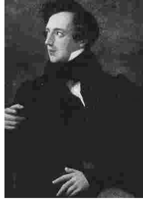
Resim 2: Felix Mendelssohn

Felix ve Fanny Mendelssohn’nun (Resim1 ve 2) Aristokrat ailelerinin evlerinde ve konser salonlarında kazandığı üstün başarıları sonucunda babası Abraham Mendelssohn- ataerkil sistemde kadın olarak kızının kadınsı tavır beslemesini isteyerek - “Müzik çalışmaların konusunda bana yazdıkların, kardeşin Felix’in çalışmaları hakkında düşündüklerin... Bunların hepsi güzel şeyler. Müzik kardeşin için belki bir meslek olacak, fakat senin için bir süsten öteye gidemeyecek. Bu anlayışla hareket et. Kadınlara sadece kadınsı bir tavır yakışır” diye yazmıştır ( www.alinteri.org , 13/ 10/ 2006, www.musicforpianos.com , 22/10/ 2006).