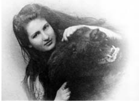
Resim: 8, 9: Alma Maria Schindler