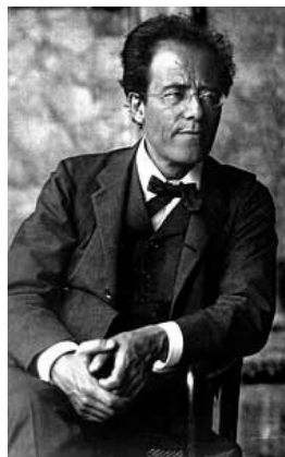
Resim: 10- 11: Alma ve Gustav Mahler Çifti