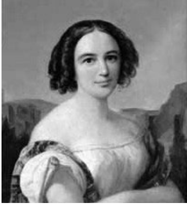
Resim 1: Fanny Mendelssohn