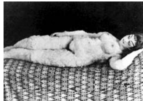
Resim:12, 13, 14: Oskar Kokoschka'nın Alma için yaptığı resimler